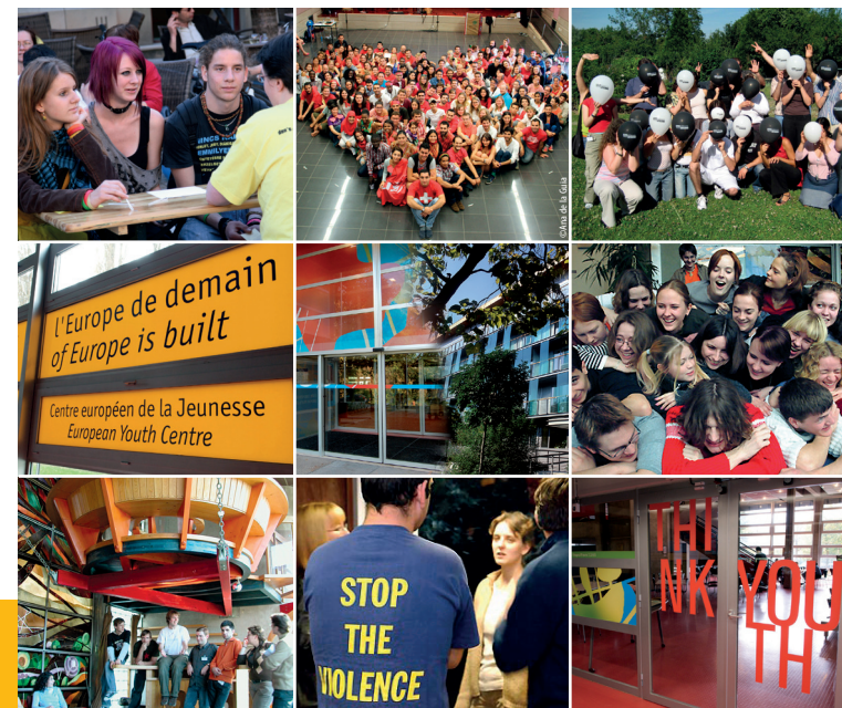
PREMS 158043 FRA 2013