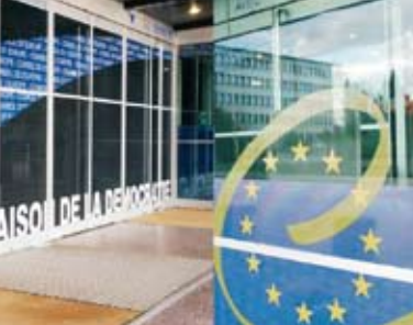
„Euroopa Pääle“ sissepääs