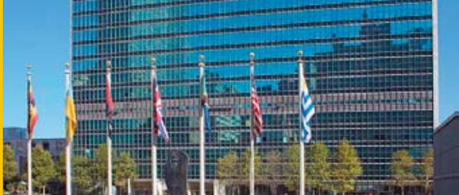
ÜRO hoone New Yorgis

Ametlikud suhted Euroopa Nõukogu ja ÜRO vahel said alguse 1951. aastal. 1989. aasta oktoobris anti Euroopa Nõukogule vaatlejastaatus Ühinenud Rahvaste Organisatsiooni (ÜRO) Peaassamblees. ÜRO piirkondliku partnerina osaleb Euroopa Nõukogu regulaarselt peamiste ÜRO allasutuste töös.