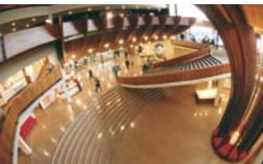
„Euroopa Palee“ vestibüül