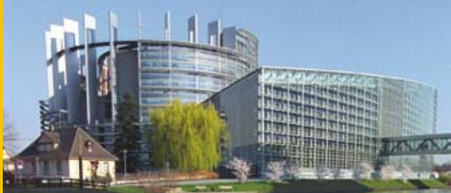
Euroopa Parlamendi hoone Strasbourgis

Euroopa Nõukogul ja Euroopa Liidul on pikaajalised koostöötraditsioonid, mis tuginevad jagatud väärtustele: inimõigustele, demokraatiale ja õigusriigile. Kumbki saab kasu teise tugevustest ja suhtelistest eelistest, pädevusest ja asjatundlikkusest, vältides samas tarbetut dubleerimist.