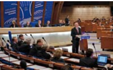
Parlamentaarne Assamblee istung