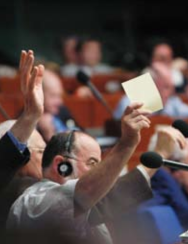
Kohalike ja Regionaalsete Omavalitsuste Kongressi istung