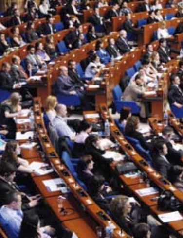
„Euroopa Palee“ nõupidamisruum