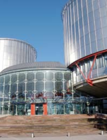
Inimõiguste hoone Strasbourgis