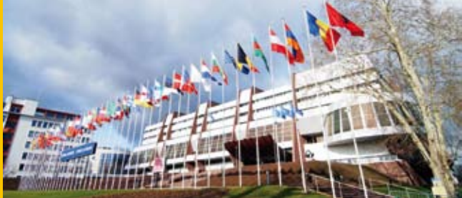
„Euroopa Palee“ Strasbourgis

Suhetes teiste rahvusvaheliste organisatsioonide ja institutsioonidega, eriti Euroopa Liidu, OSCE ja ÜROga, jälgib Euroopa Nõukogu, et tema tegevus oleks kooskõlas ühise eesmärgiga rajada demokraatlik ja turvaline Euroopa.