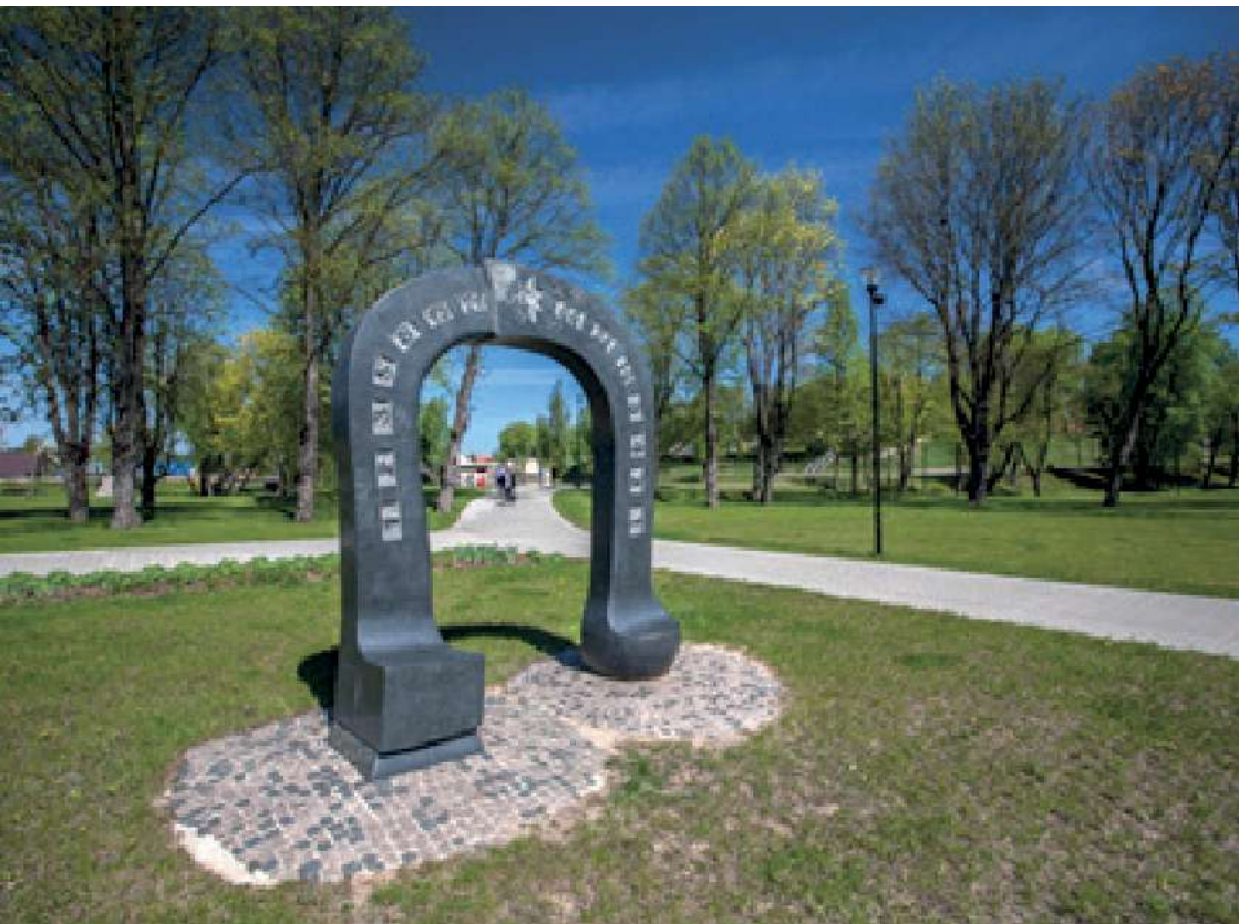
© District de la municipalité d'Utena