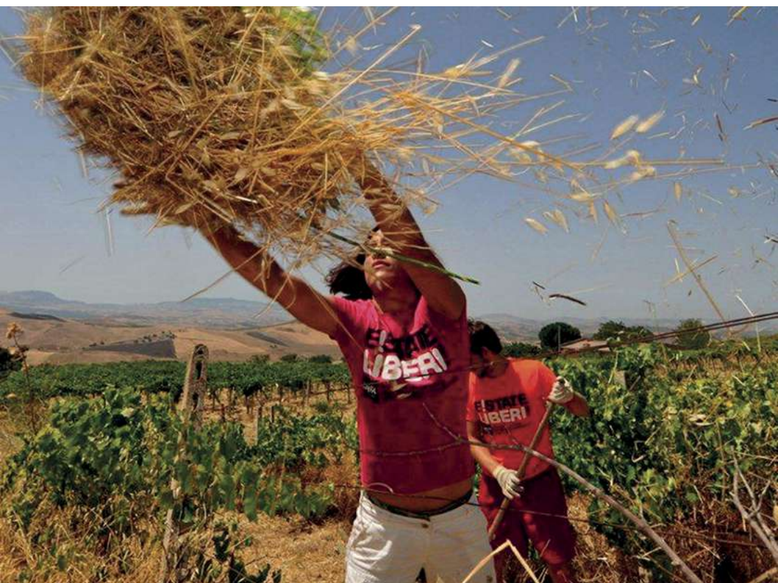
© LIBERA, Association noms et chiffres contre les mafias