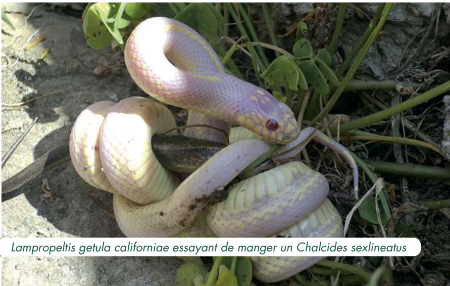
Lampropeltis getula californicae essayant de manger un Chalcides sexlineatus