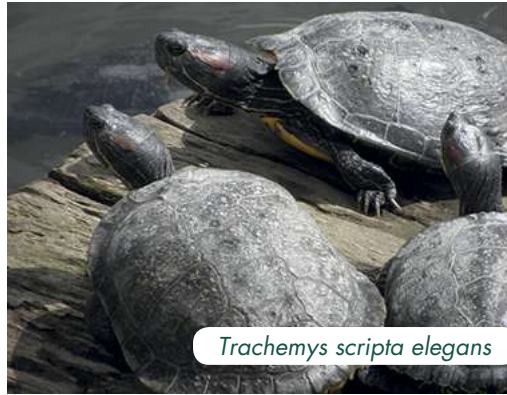
Trachemys scripta elegans

Là aussi, seule une espèce figure dans la liste des 100 principales espèces envahissantes – pour un total de 72 espèces de reptiles relevées. Cette espèce est la célèbre tortue de Floride ( Trachemys scripta elegans ). Tout comme la grenouille-taureau, l'importation de cette espèce dans l'UE est interdite en vertu des règles européennes de la CITES. La seule source 'd'introduction' a été le commerce des animaux familiers et de compagnie. Heureusement,