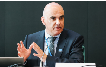
Alain Berset Generalsekretär

D en Europarot ass déi wichtegst Mënscherechtsorganisatioun vum Kontinent.