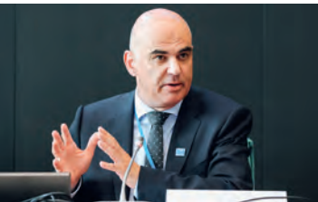
Alain Berset Peasekretär

E uroopa Nõukogu on mandri juhtiv inimõiguste organisatsioon.