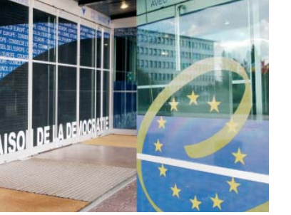
У входа во "Дворец Европы"

Институт Комиссара по правам человека – это независимая составная часть Совета Европы. Согласно своему мандату, Комиссар отвечает за осведомленность населения о принципах прав человека и уважение этих принципов со стороны государств, входящих в Совет Европы. Комиссар исполняет преимущественно «профилактические» функции и этим кардинально отличается от Европейского суда по правам человека и других подобных институтов. Исполнительной властью Комиссар не обладает.