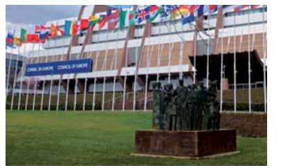
Основное здание Совета Европы «Дворец Европы» и скульптура М. Г. Бальтара