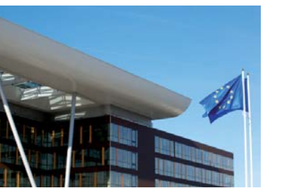
Одно из новых зданий Совета Европы называется "Агора"