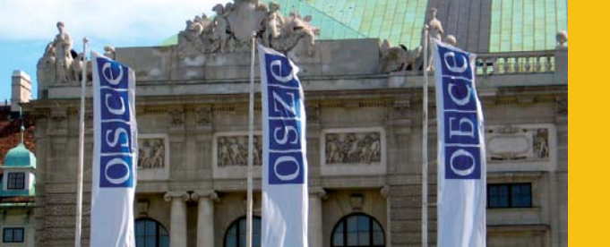
Штаб-квартира ОБСЕ в Вене