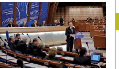
На сессии ПАСЕ