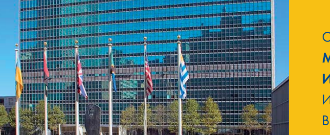
Здание ООН в Нью-Йорке