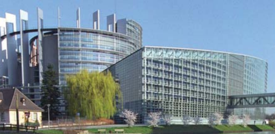
Здание Европарламента в Страсбурге