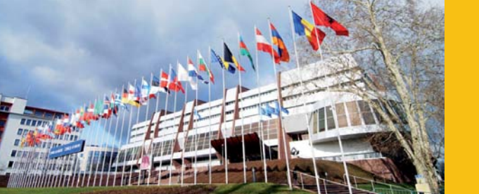
"Дворец Европы" в Страсбурге