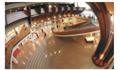
Балстрада на входе во "Дворец Европы"