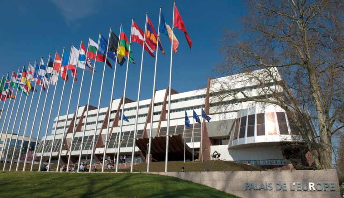
PALAIS DE L'EUROPE