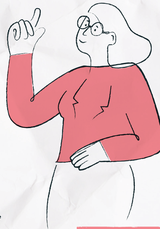
Convention de Lanzarote

Le Conseil de l'Europe compte 47 États membres, qui se trouvent sur tout le continent européen. Depuis 1949, il a pour mission de promouvoir la démocratie et de protéger les droits de l'homme.