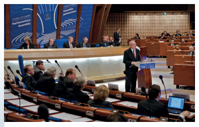
Sitzung der Parlamentarischen Versammlung