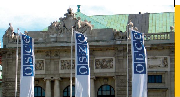
Sitz der OSZE, Wien