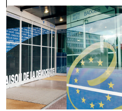
Eingang am Palais de l'Europe

Der Kommissar ist eine unabhängige Institution und es liegt in seiner Verantwortung, über die Menschenrechte aufzuklären und das Bewusstsein für diese zu schärfen und in den Mitgliedsstaaten die Achtung der Menschenrechte sowie die vollständige Übereinstimmung der nationalen Gesetzgebungen mit den standardsetzenden Rechtsinstrumenten des Europarates sicherzustellen. Der Kommissar spielt im Wesentlichen eine präventive Rolle und erfüllt andere Funktionen als der Europäische Gerichtshof für Menschenrechte und andere vertraglich geschaffene Organisationen. Der Kommissar besitzt keine Exekutivmacht.