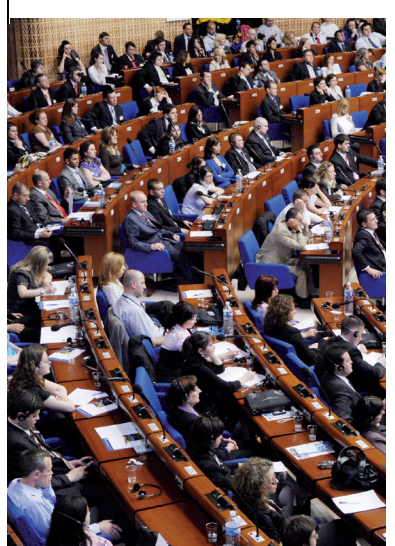
Plenarsaal, Palais de l'Europe

Herausgegeben von der Direktion für Kommunikation, Europarat. Redaktion: Abteilung Öffentlichkeitsarbeit in Zusammenarbeit mit dem Direktorat Externe Beziehungen Design und Layout: Documents and Publications Production (DPP), Europarat, September 2012