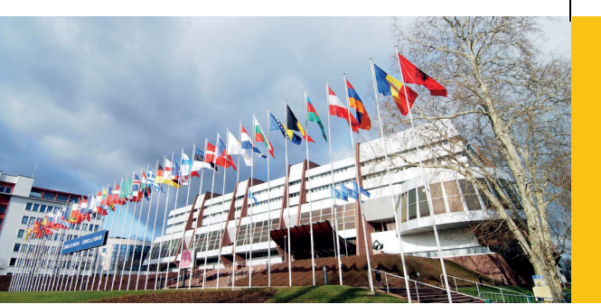
Palais de l'Europe, Straßburg