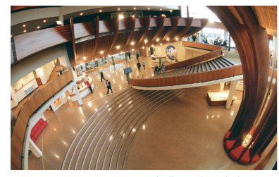
Eingangshalle, Palais de l'Europe