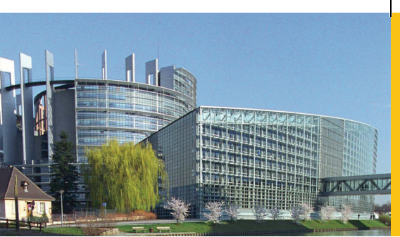
Gebäude des Europäischen Parlaments, Straßburg