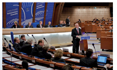
Session de l'Assemblée Parlementaire