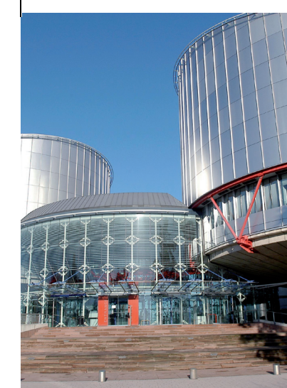
Le Palais des droits de l'homme, Strasbourg

La conférence regroupe quelque 400 ONG internationales. Elle instaure des liens essentiels entre les responsables politiques et le public, et fait entendre la voix de la société civile au Conseil. Les compétences des OING et leur proximité avec les citoyens européens profitent grandement aux travaux du Conseil.