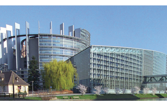
Le bâtiment du Parlement européen, Strasbourg

Le Conseil de l'Europe et l'Organisation pour la sécurité et la coopération en Europe (OSCE) visent, à leur façon propre, à promouvoir la sécurité et la stabilité sur la base de la démocratie, de l'Etat de droit et du respect des droits de l'homme en Europe.