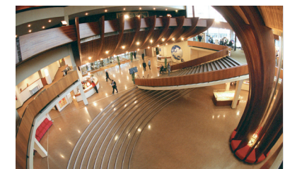
Le hall d'entrée du Palais de l'Europe