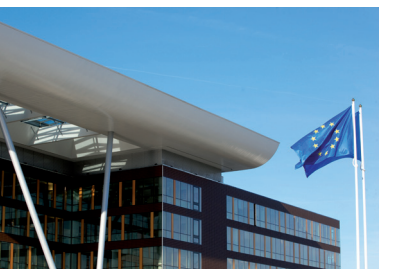
Le bâtiment de l'Agora