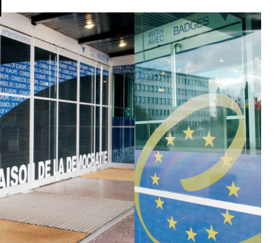
L'entrée du Palais de l'Europe

Le Commissaire représente une institution indépendante chargée de promouvoir, dans les États membres, l'éducation et la sensibilisation aux droits de l'homme, d'assurer leur respect ainsi que la conformité pleine et entière des législations nationales avec les instruments normatifs du Conseil de l'Europe. Le Commissaire joue un rôle essentiel de prévention, remplissant des fonctions différentes de celles de la Cour européenne des droits de l'homme et d'autres organisations résultant d'un traité. Le Commissaire n'a pas de pouvoir exécutif.