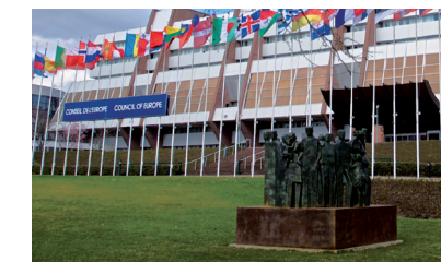
Le Palais de l'Europe, avec la sculpture « Droits de l'homme » de Mariano González Beltrán