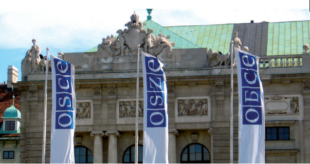
Le siège de l'OSCE à Vienne

Les relations officielles entre le Conseil de l'Europe et les Nations Unies remontent à 1951. Le Conseil de l'Europe a obtenu le statut d'observateur auprès de l'Assemblée générale des Nations Unies (ONU) en octobre 1989.