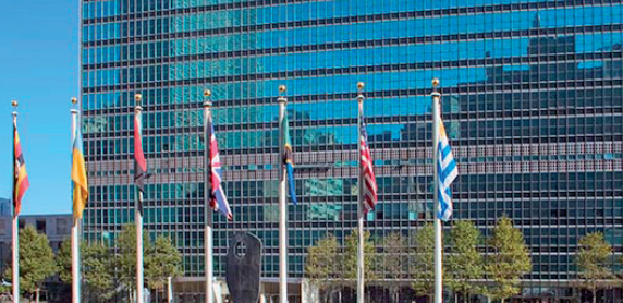
Zgrada Ujedinjenih nacija, New York

Zvanični odnosi Vijeća Evrope sa UN-om datiraju još od 1951. godine. Vijeće Evrope je dobilo status promatrača pri Generalnoj skupštini UN-a u oktobru 1989. Vijeće Evrope redovno učestvuje u radu glavnih UN agencija u svojstvu regionalnog partnera.