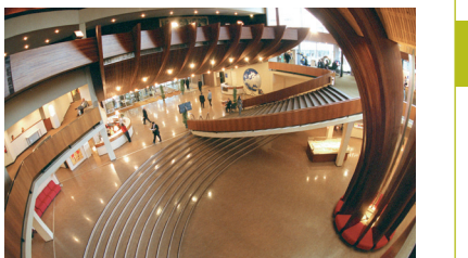
Ulaz, "Palata Evrope"