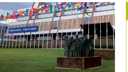
"Palata Evrope" sa skulpturom "Ljudska prava" autora Mariano Gonzalesa Beltran-a