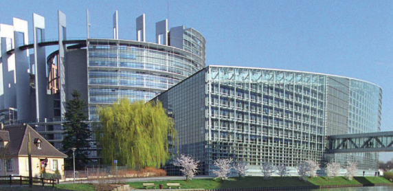
Fotografija:Zgrada Evropskog parlamenta, Strasbourg

Vijeće Evrope i Evropska unija imaju dugu tradiciju saradnje zasnovanu na zajedničkim vrijednostima: ljudska prava, demokracija i vladavina prava. Obje organizacije koriste jedna od druge jake i komparativne prednosti, znanja i ekspertize uz izbjegavanje nepotrebnog dupliciranja.