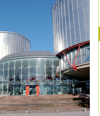
Zgrada Ljudskih prava, Strasbourg

Konferencija uključuje oko 400 ne-vladinih organizacija. Ona omogućava vitalnu vezu političara sa javnošću i dovodi glas civilnog društva u Vijeće Evrope. Vijeće Evrope u svom radu uveliko koristi ekspertizu MNVO-a i njihov kontakt sa građanima.