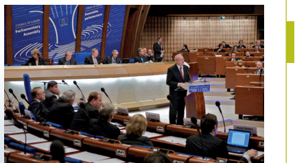
Sjednica Parlamentarne skupštine VE