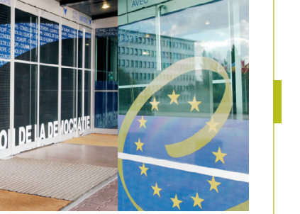
"Palata Evrope" ulaz

Komesar je neovisna institucija zadužena za promociju obrazovanja i podizanje svijesti o ljudskim pravima u državama članicama i za osiguranje njihovog poštivanja kao i potpune usklađenosti nacionalnog zakonodavstva sa normativnim instrumentima Vijeća Evrope. Komesarova uloga je u osnovi preventivna i drugačija od onih koje imaju Evropski sud za ljudska prava i druge organizacije nastale na osnovu ugovora. Komesar nema izvršnu moć.