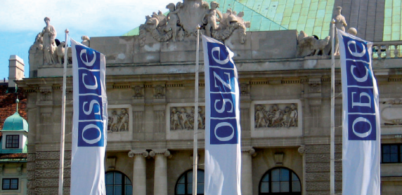
Sjedište OSCE-a u Beču

Vijeće Evrope i Organizacija za bezbjednost i saradnju Evrope (OSCE) bave se, svaka na svoj način, promocijom stabilnosti i bezbjednosti na osnovu demokracije, vladavine zakona i poštavanja ljudskih prava.