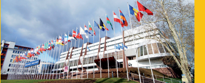
«Palata Evrope», Strasburg

U odnosima sa drugim međunarodnim organizacijama, prvenstveno sa Evropskom unijom, OSCE-om i UN-om, Vijeće Evrope osigurava da aktivnosti koje se provode budu komplementarne zajedničkom cilju izgradnje demokratske i sigurne Evrope.