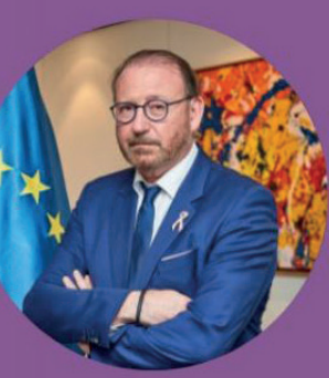
Rik Daems, President of the Parliamentary Assembly of the Council of Europe