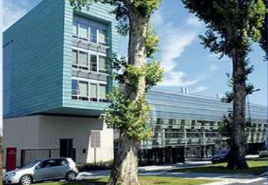
European Youth Centre Centre européen de la jeunesse