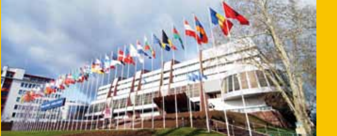
Pałac Europy, Strasburg