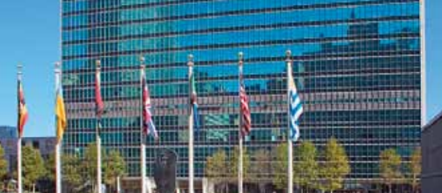
Budynek ONZ, Nowy Jork

Rada Europy kontynuuje ścisłą współpracę z różnymi agendami ONZ, w tym z Wysokim Komisarzem ds. Uchodźców oraz Praw Człowieka, Funduszem Narodów Zjednoczonych na Rzecz Dzieci oraz Biurem ONZ ds. Koordynacji Pomocy Humanitarnej, Programem Rozwoju (UNDP) ONZ, Europejską Komisją Gospodarczą ONZ i Radą Praw Człowieka. Planuje się realizację wspólnych projektów z inicjatywą „Sojusz Cywilizacji” (Alliance of Civilisations).