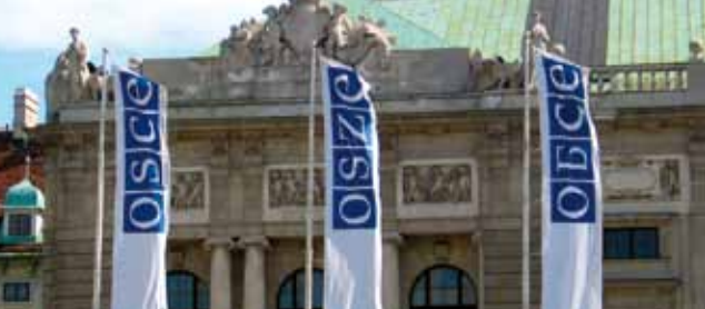
Główna siedziba OBWE, Wiedeń

Obecnie współpraca Rady Europy z OBWE koncentruje się na czterech obszarach priorytetowych: zwalczanie terroryzmu, ochrona mniejszości narodowych, zwalczanie handlu ludźmi oraz kwestie dotyczące tolerancji i dyskryminacji.