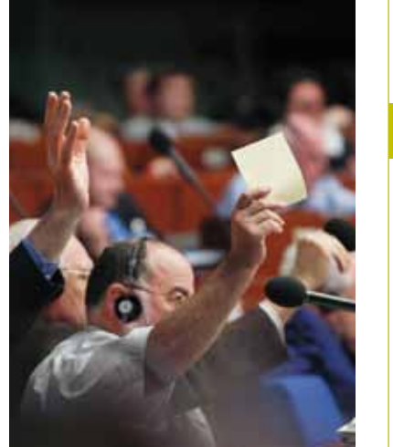
Kongres Władz Lokalnych i Regionalnych

Zgromadzenie Parlamentarne to polityczna siła napędowa Rady Europy. Składa się z 636 członków, bądź zastępców członków parlamentów narodowych, 47 państw członkowskich, którzy debatują nad tekstami przedłożonymi do przyjęcia. Te teksty lub zalecenia stanowią ważne wytyczne dla Komitetu Ministrów, rządów i parlamentów narodowych. Zgromadzenie zgłosiło wiele projektów traktatów międzynarodowych, przyczyniając się do stworzenia paneuropejskiego systemu prawnego.