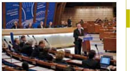
Sesja Zgromadzenia Parlamentarnego