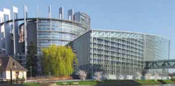
Budynek Parlamentu Europejskiego UE, Strasburg

Te działania są w chwili obecnej prowadzone na podstawie decyzji podjętych na Trzecim Szczyście szefów państw lub rządów, który miał miejsce w Warszawie w 2005 roku. Deklaracja Warszawska oraz Plan Działań stanowią potwierdzenie roli Rady Europy na arenie europejskiej poprzez zdefiniowanie kluczowych celów tej Organizacji. Szefowie państw lub rządów zadeklarowali swą determinację w „zapewnieniu komplementarności Rady Europy z innymi organizacjami zaangażowanymi w budowę demokratycznej i bezpiecznej Europy”, wyraźnie koncentrując się na relacjach z Unią Europejską, OBWE oraz ONZ.