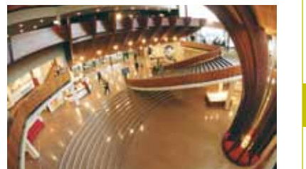
Hol wejściowy w Pałacu Europy