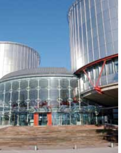
Budynek Praw Człowieka, Strasburg

Konferencja zrzesza około 400 międzynarodowych organizacji pozarządowych. Stanowi ona ważny łącznik między politykami a społeczeństwem i jest głosem społeczeństwa obywatelskiego na forum Rady Europy. Rada szeroko korzysta z ekspertyz INGOs i jej kontaktów z obywatelami Europy.