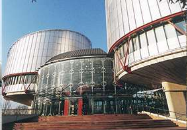
Human Rights building Palais des droits de l'homme