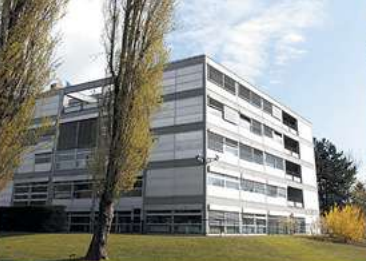
European Youth Centre Centre européen de la jeunesse