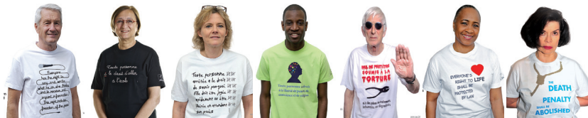
Thorbjörn Jagland Ex Segretario generale del Consiglio d'Europa

Sei tu a scegliere il tema: per esempio il diritto alla vita, la libertà d'espressione, il divieto di discriminazione o il diritto all'istruzione.