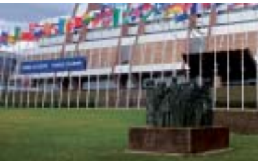
Eiropas pils un skulptūra „Cilvēktiesības” (Mariano Gonsales Beltrans)