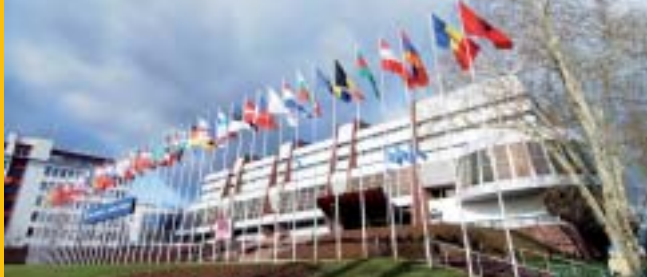
Eiropas pils, Strasbūra

Sadarbībā ar citām starptautiskajām organizācijām un institūcijām, īpaši ar Eiropas Savienību, EDSO un Apvienoto Nāciju Organizāciju, Eiropas Padome nodrošina savas rīcības atbilstību kopīgam mērķim – demokrātiskas un drošas Eiropas veidošanai.