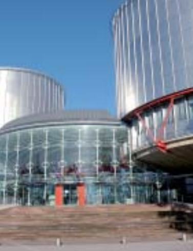
Cilvēktiesību ēka, Strasbūrā