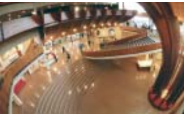
Eiropas pils vestibāls