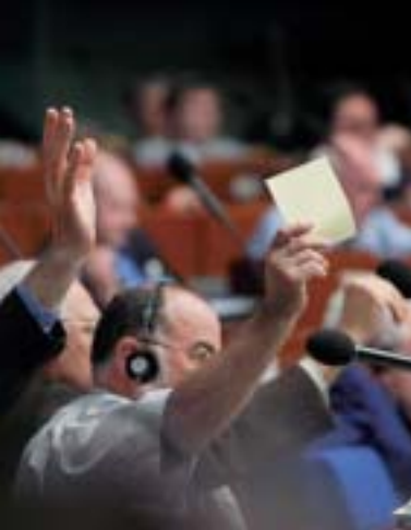
Vietējo un reģionālo pašvaldību kongresa sesija