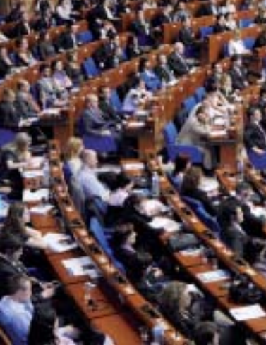
Debašu zāle, Eiropas pils