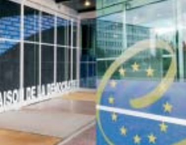
Eiropas pils ieeja