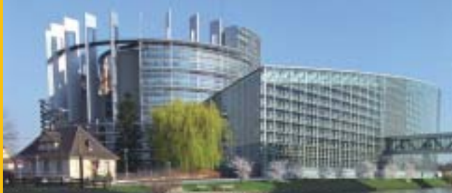
Eiropas Parlamenta ēka, Strasbūra

Eiropas Padomei un Eiropas Savienībai (ES) ir ilgas sadarbības tradīcijas, kas koncentrējas uz kopīgām vērtībām: cilvēktiesībām, demokrātiju un tiesiskumu. Abas iegūst no otras stiprajām pusēm un priekšrocībām, kompetencēm un ekspertiem, izvairoties no nevajadzīgas dublēšanās.