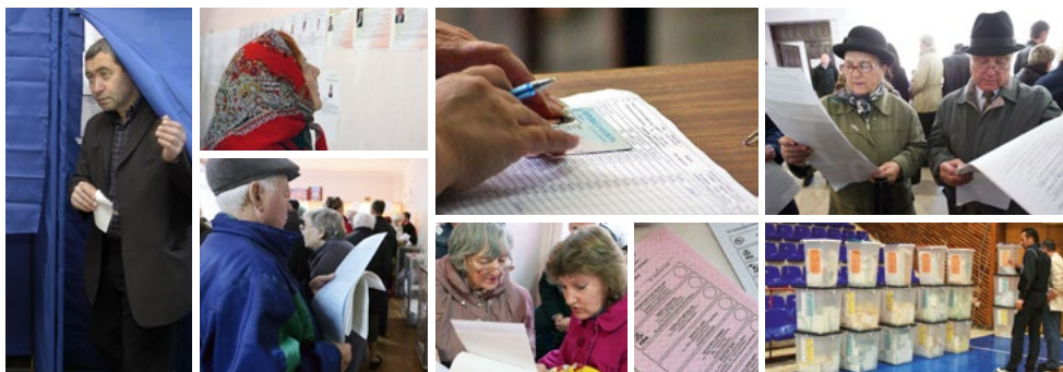
Les délégations du Congrès observent l'ensemble du processus électoral.

L'observation des élections est une activité prioritaire du Congrès du Conseil de l'Europe. Elle contribue à assurer l'intégrité électorale et à améliorer la confiance des électeurs au niveau local.