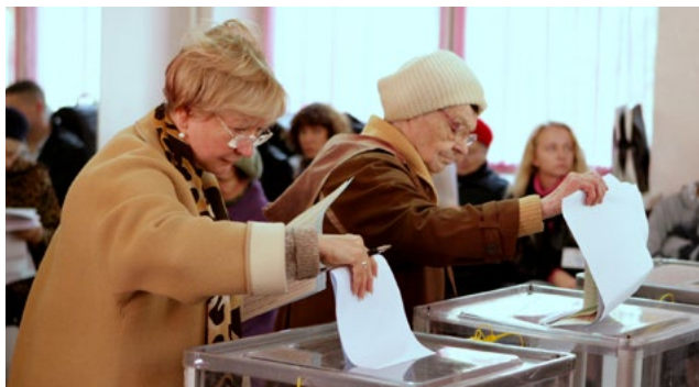
Citoyens exerçant leur droit de vote.

Le Congrès met en place un mécanisme d'examen entre pairs pour évaluer les processus électoraux à l'échelle territoriale