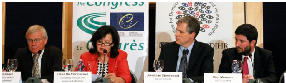
Présentation des conclusions préliminaires conjointes de l'OSCE/BIDDH et du Congrès suite aux élections locales (Albanie, mai 2011).

Le Congrès assure le suivi de ses recommandations par la mise en place de programmes spécifiques et de partenariats avec des institutions clefs œuvrant pour des élections locales et régionales véritablement démocratiques partout en Europe.