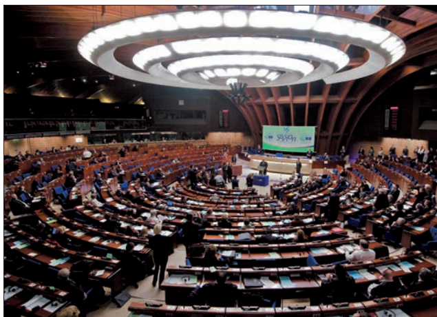
I rapporti di monitoraggio sono discussi e adottati nel corso delle sessioni plenarie del Congresso

La verifica amministrativa delle collettività locali deve essere esercitata nel rispetto di un equilibrio tra la portata dell'intervento dell'autorità di