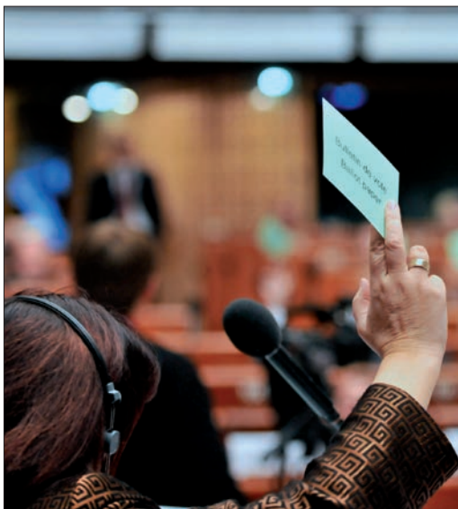
Il libero esercizio del mandato di un amministratore eletto si esprime anche attraverso il voto

“[ ... ] le collettività locali devono poter definire esse stesse le strutture amministrative interne di cui intendono dotarsi, per adeguarle alle loro esigenze specifiche in