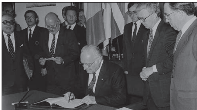
Oscar-Luigi Scalfaro, Ministro dell'Interno della Repubblica Italiana, firma la Carta, il 15 ottobre 1985, a Strasburgo, Francia

Tutti i cittadini europei, indipendentemente dal regime costituzionale, federale o unitario, dello Stato in cui risiedono, si considerano anzitutto cittadini di un ente locale, di cui hanno eletto gli organi di governo.