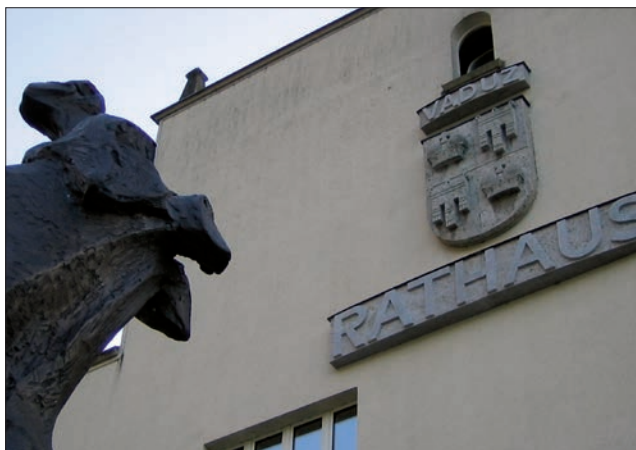
Municipio di Vaduz, foto scattata in occasione di una missione di monitoraggio della democrazia locale nel Liechtenstein.

Il riconoscimento della democrazia locale da parte degli Stati membri del Consiglio d'Europa ha condotto all'adozione, nel 1985, della Carta europea dell'autonomia locale. Il testo sancisce il ruolo delle collettività in quanto primo livello in cui è esercitata la democrazia. È diventato il trattato internazionale di riferimento in questo campo.