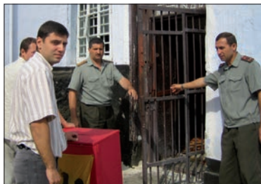
Un'urna elettorale in un carcere di Chisinau (Moldova). Il rispetto dei diritti civili, anche in prigione, è il segno della qualità della democrazia locale in un paese.

Numerose riforme legislative sono state avviate dagli Stati membri in seguito ai risultati delle attività di monitoraggio e delle raccomandazioni del Congresso.