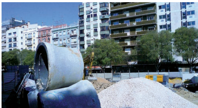
Le risorse finanziarie di una collettività locale devono permetterle, ad esempio, di realizzare dei lavori di assetto urbano.