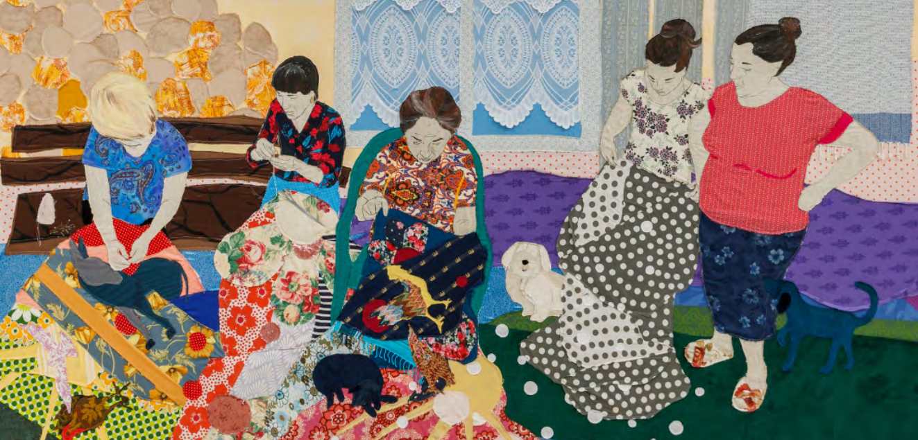
Matgorzata Mirgas-Tas, March , 462 x 387 cm, acrylique sur textile, châssis en bois, 2022. Avec l'aimable autorisation de l'artiste et de la Foksal Gallery Foundation. Collection Bonnefanten. Photo*$$*: Jacopo Salvi.