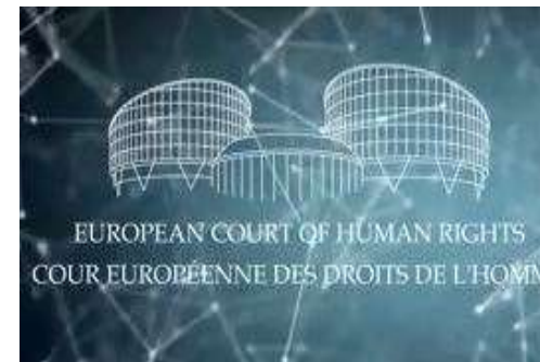
Cour européenne des droits de l'homme