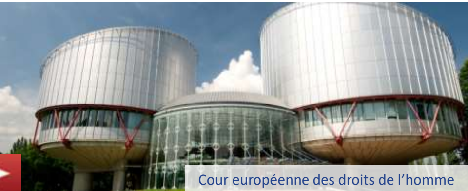
Cour européenne des droits de l'homme