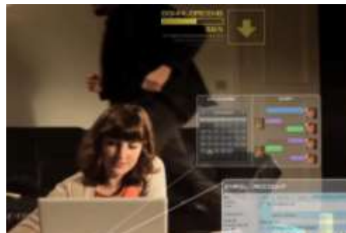
Protection des données