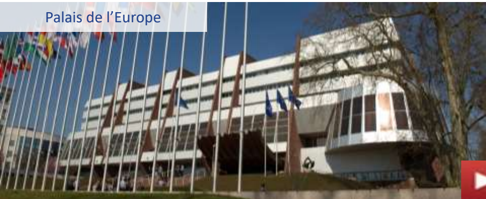
Palais de l'Europe